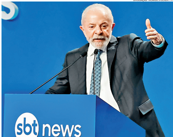
Presidente Lula falou sobre PL da Dosimetria durante entrevista ao SBT News na segunda-feira (15)

“Eu só acho que o cidadão que tentou dar um golpe nesse país, que tentou fazer mentir a tempo inteiro na governança dele, que é responsável pela morte de me-